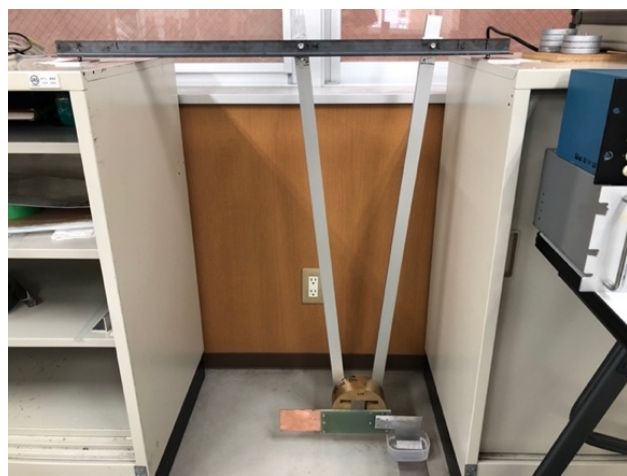
月の引力測定 実験装置の全体写真